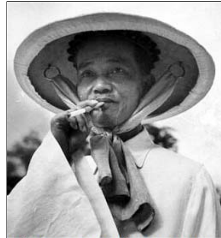
Ông Phạm Công Tắc Chủ Tịch Mặt Trận Thống Nhất Toàn Lực Quốc Gia