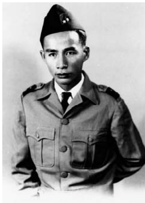
Tướng Trình Minh Thế